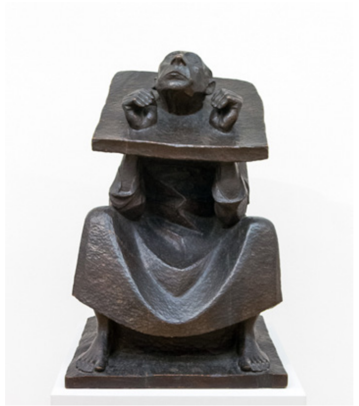
Der Mann im Stock, Ernst Barlach, 1918

Ils rient, c'est un fou rire collectif qui s'installe peu à peu. Ils rient d'eux-mêmes. De cette énorme blague. Ils partent en ballade, en marche militaire, en danse endiablée. Les carcans deviennent des boucliers de guerriers romains. Ils évoquent également des collerettes de dragon. Quand ils se tournent vers nous en se rapprochant, ils ne font plus qu'un seul monstre à six têtes.